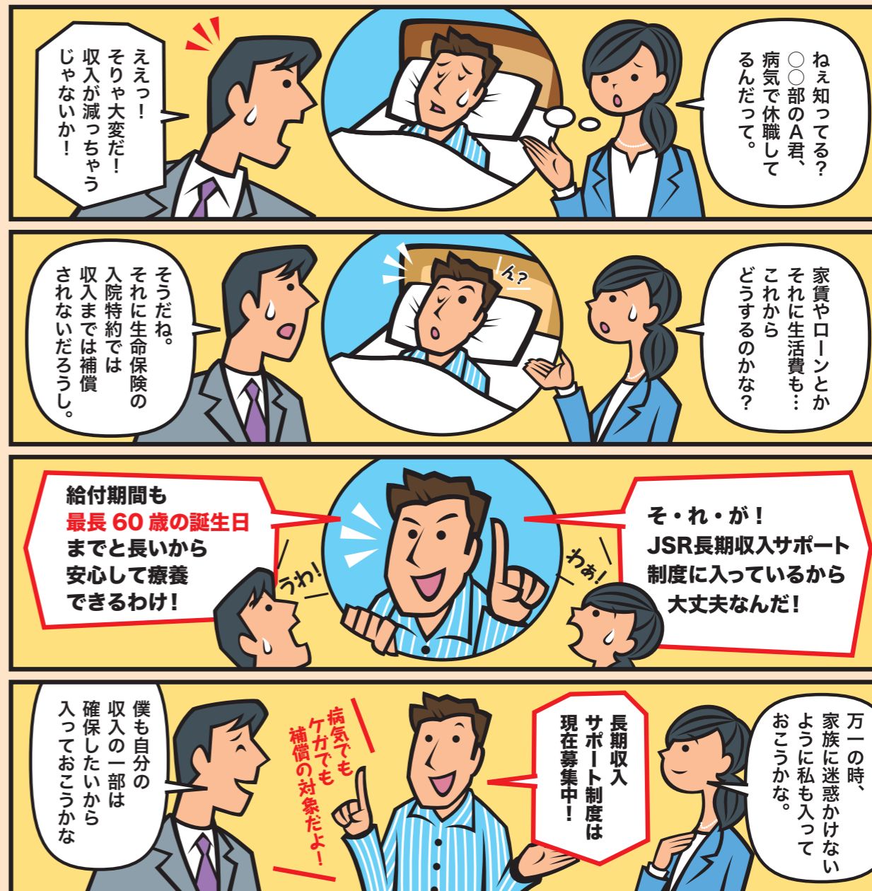
この制度の詳細な内容は、中面をご確認ください。

JSRでは、社員の皆さんが病気やけがにより万が一働けなくなった場合に備え、「長期収入サポート制度」を導入しています。 補償を万全なものとしていただくために、上乗せ補償である任意加入契約をご案内いたします。